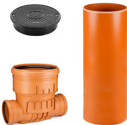
Revizní kanalizační šachta

Dovolím si odpovědět na jeden z dotazů ohledně domovních revizních kanalizačních šachet. V tuto chvíli je kanalizační přípojka k domu ukončena těsně před pozemkem (nebo cca 1 metr na pozemku) kontrolní šachtou v provedení trubka KGEM DN160, nebo DN200. Jedná se o vyvedení trubky na povrch z tzv. T-kusu na kanalizačním řadu přípojky. Tato vyvedená trubka na povrch slouží k nalezení přípojky splaškové kanalizace, k případnému zaslepení přípojky a kontrole kouřovou metodou provozovatelem splaškové kanalizace. Na konec trubky, která byla přivedena k Vašemu pozemku (nebo na pozemek), se bude teprve instalovat revizní kanalizační šachta.