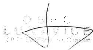
..... starosta za poskytovatele dotace